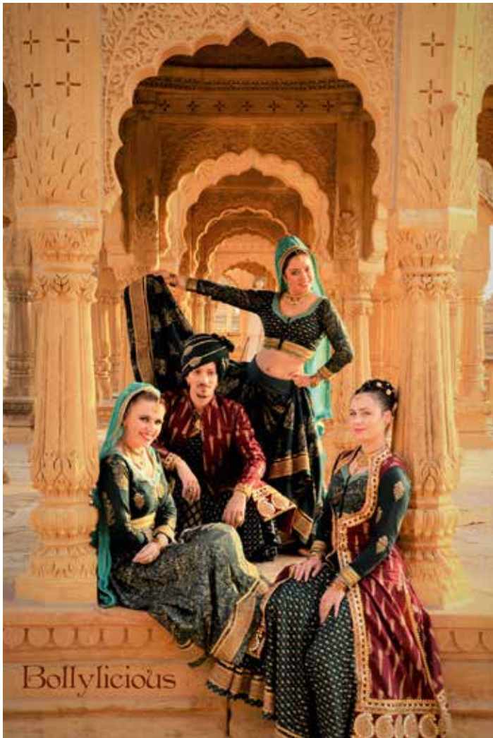
Het ensemble Bollylicious zakt af naar Dunia op 13.07

Zaterdag 6 en zondag 7 juli, Koksijde BK Kunstvliegen - Belgian Open Aerobic Championship Koksijde / championnat belge de voltige aérienne de Koksijde / Belgische Kunstflugmeisterschaften (p. 21 en 39)