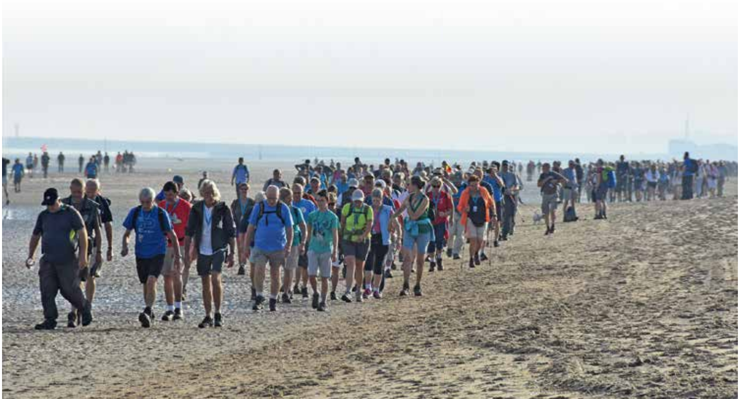
Vierdaagse van de IJzer: 20-23.08

Bos van Commerce, Oostduinkerke: winterbos op het strand / forêt d'hiver sur la plage / Winterwald (allerlei Aktivitäten am Strand)