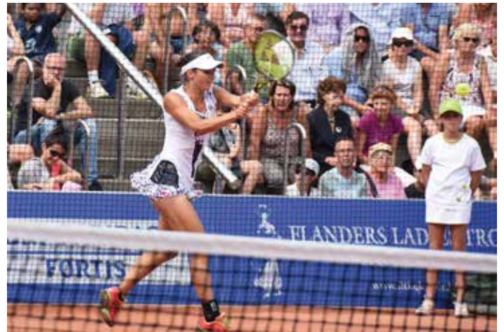
Flanders Ladies Trophy: 5-11.08

Maandag 5 tot zondag 11 augustus, Koksijde, Theaterplein Flanders Ladies Trophy: internationaal damestennisturnooi van Vlaanderen (www.fttkoksijde.be) / tournoi de tennis féminin international de Flandre / Internationales Damentennisturnier von Flandern