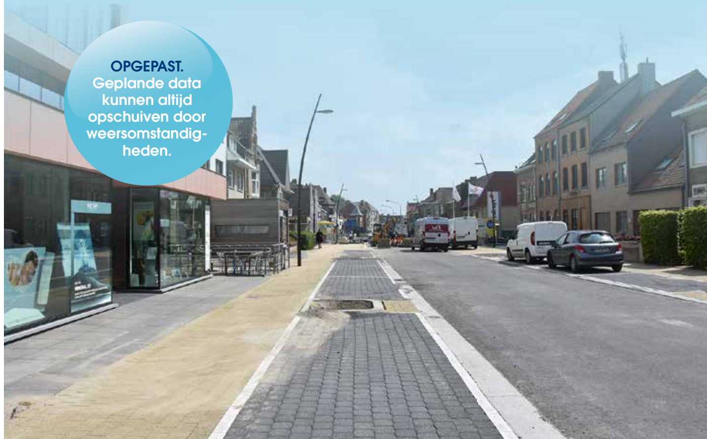
De Zeelaan is bijna klaar

OPGEPAST. Geplande data kunnen altijd opgeschuiven door weersomstandig- heden.