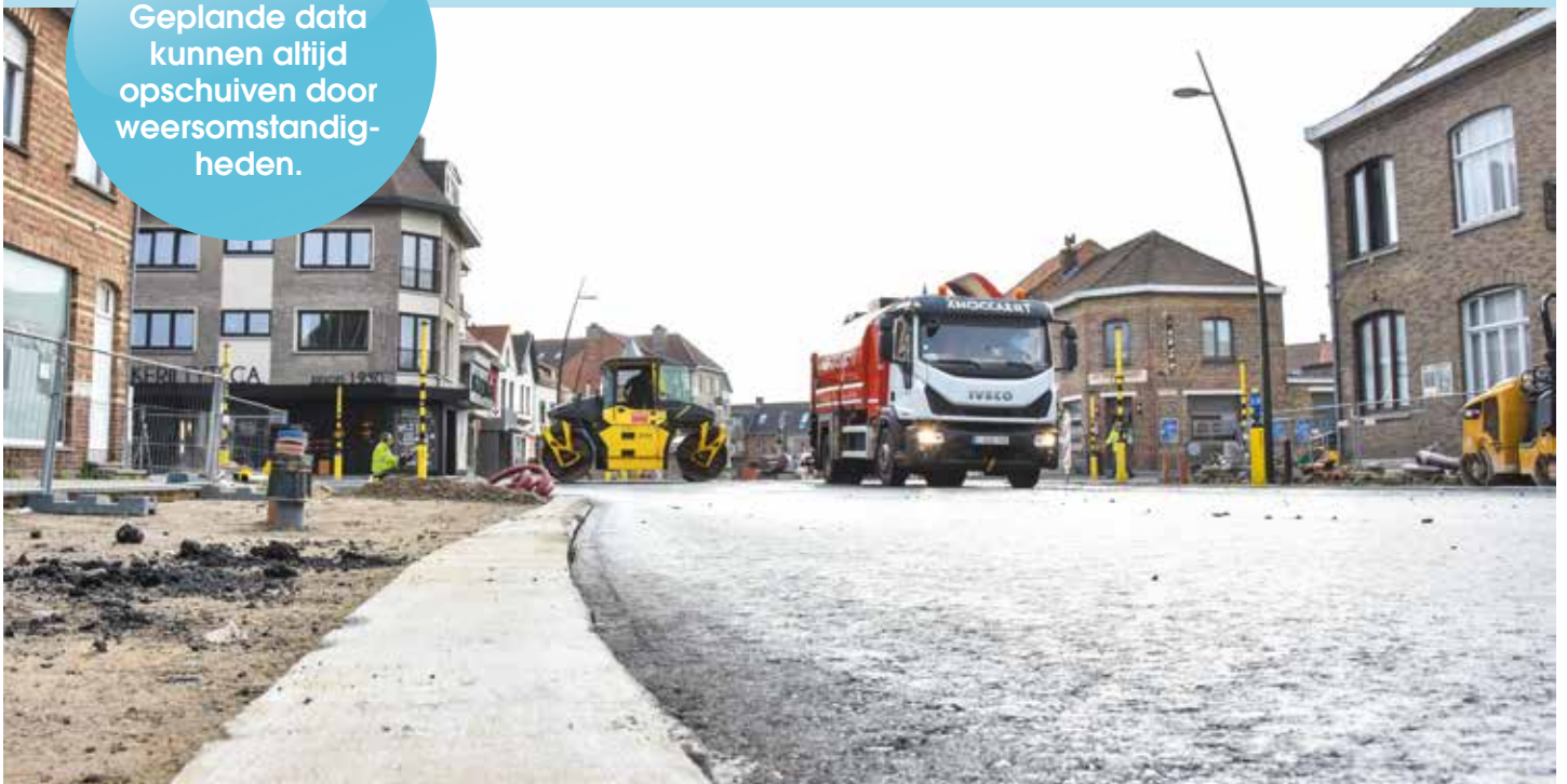
Kruispunt aan de Zeelaan is terug open

OPGEPAST. Geplande data kunnen altijd opschuiven door weersomstandigheden.