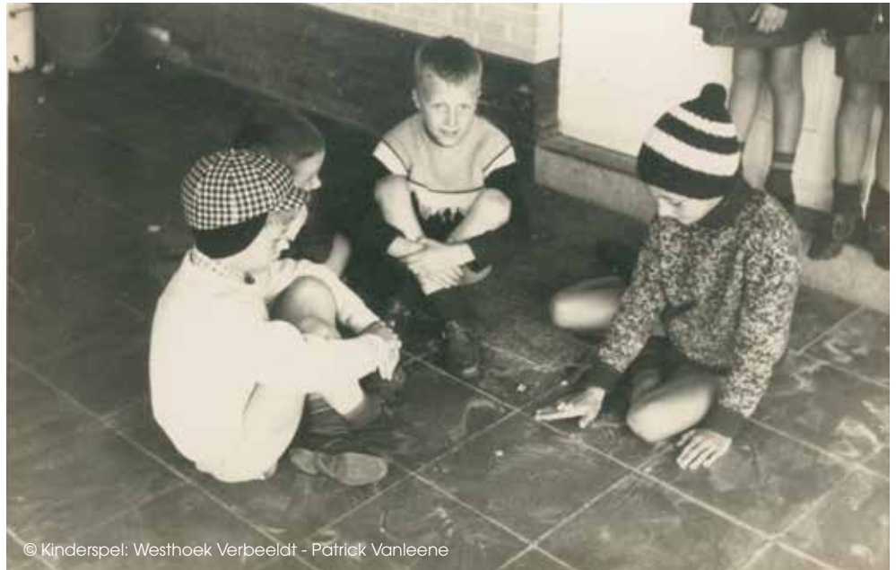
Bikkelen (of pekkelen) was al populair in het oude Griekenland.