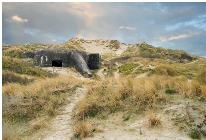
Weerstandsnest Waldensee uit de Tweede Wereldoorlog

De ce nid de résistance allemand de la Seconde Guerre mondiale restent des bunkers et des tobruks . Ce site est le seul dans notre pays qui donne une image d'un nid de résistance.