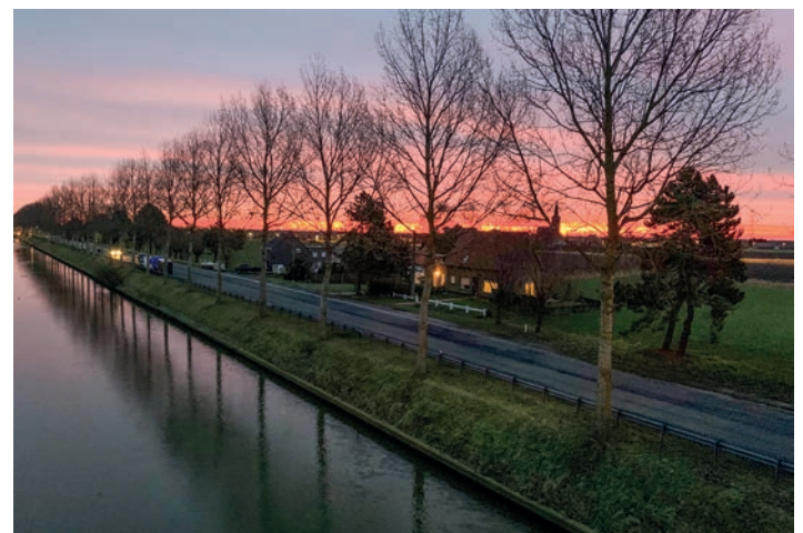
Wulpen: landelijk rustpunt

Das fortschrittliche Design regt zum Nachdenken über das Leben an und gedenkt der Menschen, die nicht mehr unter uns sind.