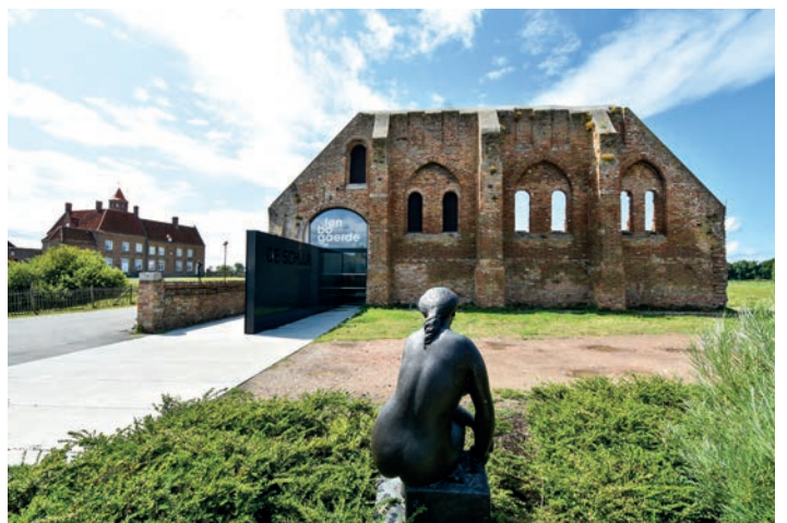
Ten Bogaerde: waar kunst en geschiedenis elkaar ontmoeten

Baaltje , wie das Dorf auch genannt wird, ist für das authentische Wirrwarr aus Straßen und charmanten Häusern bekannt.