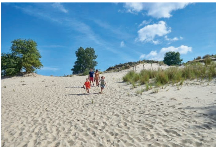
De Hoge Blekker is de hoogste duin aan onze kust

Rien n'est plus agréable que de stimuler tous vos sens avec une promenade sur la plage.