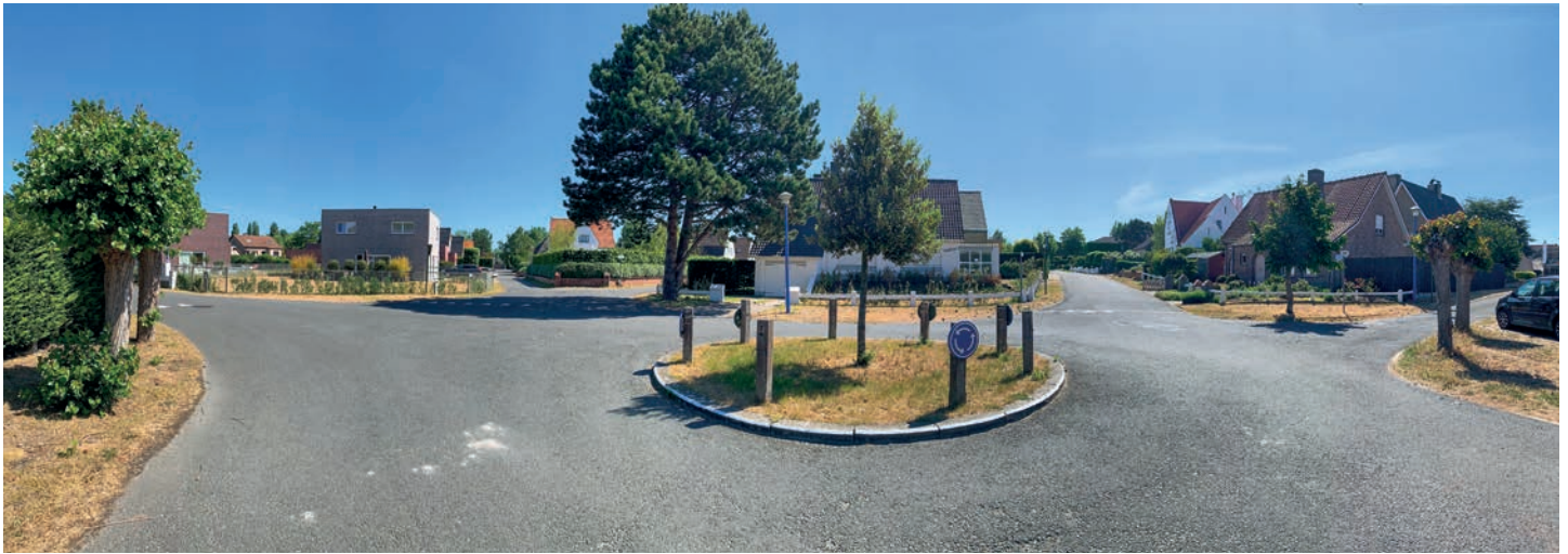
De pittoreske straatjes van Sint-Idesbald