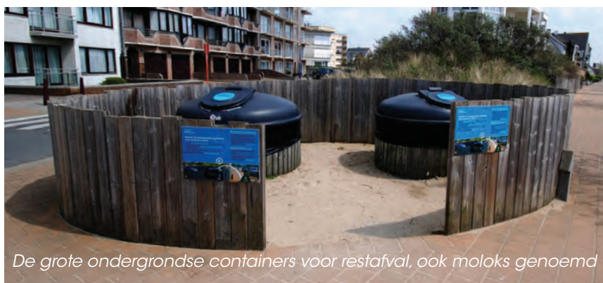
De grote ondergrondse containers voor restafval, ook moloks genoemd

Verlaat u Koksijde op een dag dat de huisvuilwagen niet langskomt, dan kunt u de reglementaire huisvuilzak deponeren in de grote ondergrondse containers voor restafval, ook moloks genoemd. Ander afval (plastic zakjes met huisvuil, glas enz.) hoort niet thuis in of rond deze container. De straatvuilnisbakjes zijn uitsluitend voor klein picknickafval. Alle info: www.koksijde.be/afvalkalender , dienst Milieu en Duurzame Ontwikkeling, 058 53 34 39, milieu@koksijde.be .