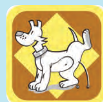
Hondentoilet / Toilette canine / Hundetoilette