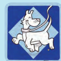
Honden toegelaten / Zone de tolérance / Hunde erlaubt