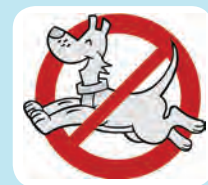
Honden verboden op het strand / Chiens interdits sur la plage / Hunde am Strand verboten