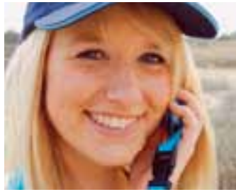
Houwtouw / Corde "Houwtouw" / Hiebtou € 1,00