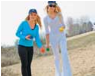
Pétanqueset € 6,50

Vous êtes un véritable fan de K? Cela fait longtemps déjà que vous aimeriez avoir un gadget K? Alors, venez vite nous voir dans notre K-shop unique et découvrez l'incroyable assortiment! A vendre auprès du service de Tourisme.