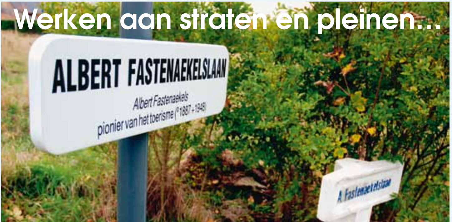
De betonnen straatnaamsokkels worden vervangen door metalen bordjes