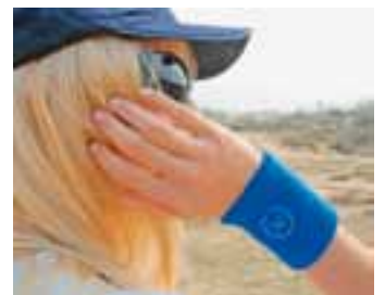
Polsbandje / Bracelet / Armband € 1,00