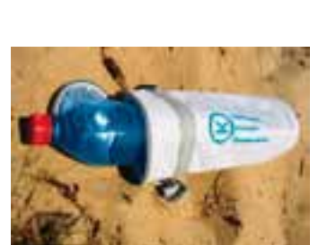
Isoleertas voor flessen / Glacière à bouteilles / Flaschenkühler € 2,40