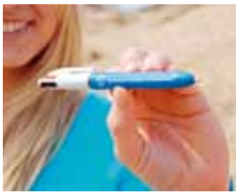
Balpen Bic 4-kleuren / Stylo Bic 4 couleurs / Kugelschreiber in 4 Farben € 1,50