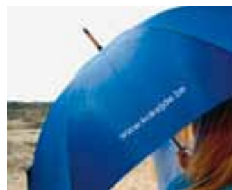
Paraplu / Parapluie / Regenschirm € 7,00