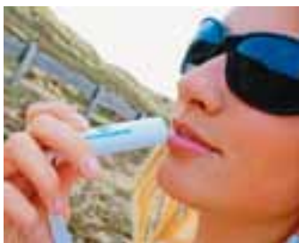
Lippenbalsem / Baume à lèvres € 1,00