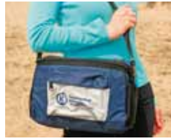
Fietstas / Sacoche de vélo / Fahrradtasche € 6,50