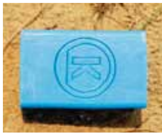
Natuurlijk zeepje / Savon naturel / Natürliche Seife € 2,70