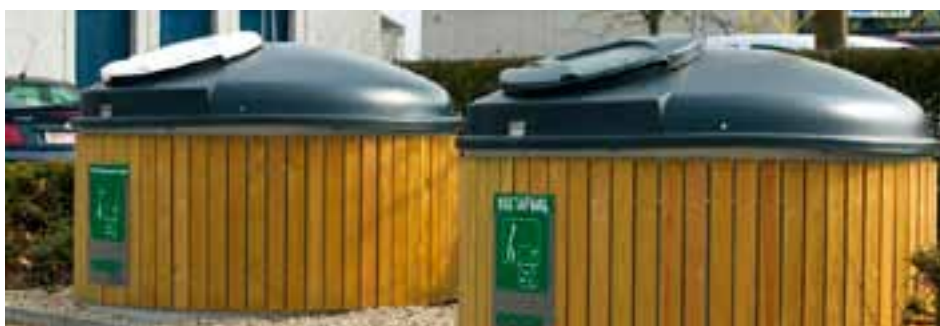
De ondergrondse containers of moloks / Les containers souterrains ou “moloks” / Die unterirdischen Container oder Moloks

Wenn Sie den Müll falsch anbieten, gilt dies als illegale Müllentsorgung, welche mit Bußgeld bestraft wird.