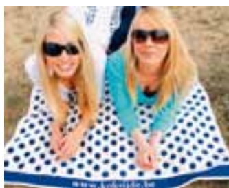
Strandlaken / Drap de plage / Strandtuch € 25,00