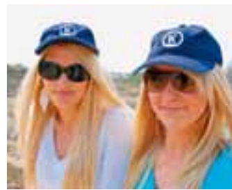
Pet in marineblauw / Caquette bleu marine / Mütze in Marineblau € 6,50