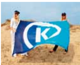
Vlag / Drapeau / Fahne € 18,00