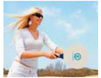
Beachbalset, 2 rackets en 1 bal € 4,00