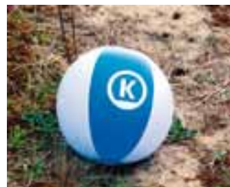
Opblaasbare strandbal / Ballon de plage gonflable / Aufblasbarer Strandball € 1,25