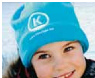
K-muts / Frans / K-Mütze € 3,00