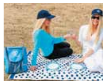
Picknick-fietstas / Sacoche de vélo pour pique-nique / Picknick-Fahrradtasche € 18,00