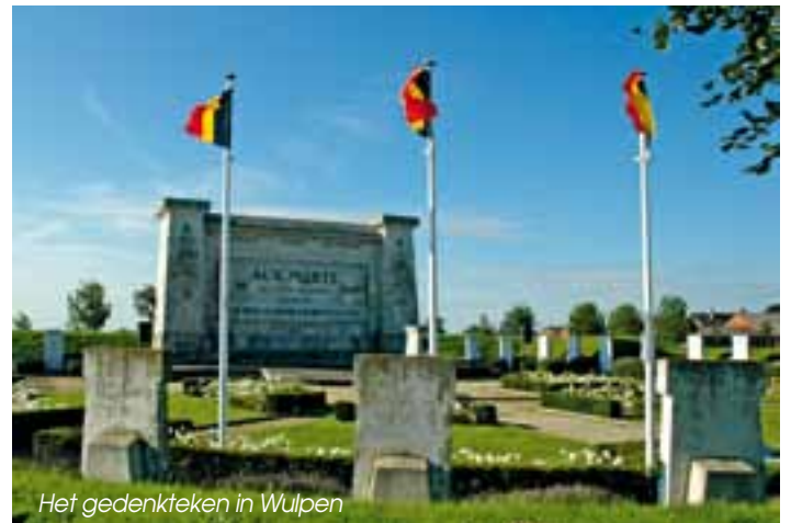
Het gedenkteken in Wulpen

N De Vlaamse regering heeft vijf oorlogsmonumenten in Koksijde beschermd als monument: het oorlogsgedenkteken bij Hegerplein/Vandammestraat in Koksijde-dorp, het Zouavenmonument in Koksijde-bad, het monument voor de vliegeniers bij de Zuid-Abdijmolen, het monument bij de kerk van Oostduinkerke, en het gedenkteken voor de 4de legerdivisie langs het kanaal in Wulpen.