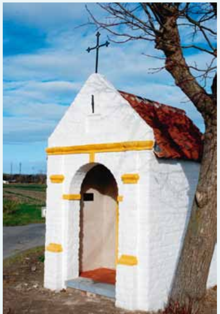
Het gerestaureerde Clercqskapelletje.

Die unter Denkmalschutz stehende kleine Clercqskapelle (Ecke Pannekalsijde/Svinckstraße) wurde in der Zeit Juni-Oktober 2009 vollständig restauriert, nachdem sie acht Jahre zuvor als ein Auto gegen die Kapelle prallte, schwer beschädigt wurde. Während des Zweiten Weltkrieges war die Kapelle fast schon ein Wallfahrtsort. Die Restaurierung kostete 35.000 Euro.