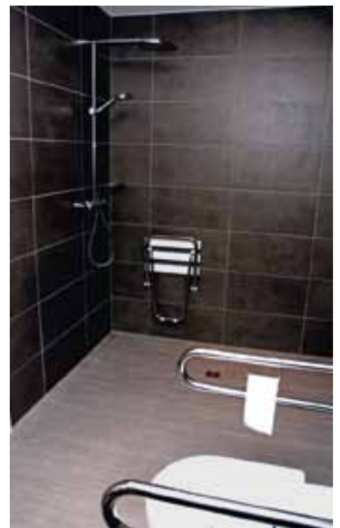
Het nieuwe hotel telt drie aangepaste hotelkamers met badkamer, voorzien van antislipvloer zoals de normen opleggen.