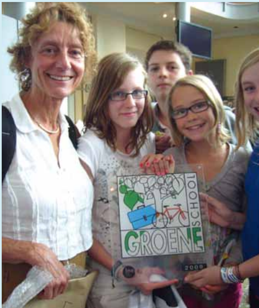
De leerlingen zijn uiteraard fier met het behaalde MOS-logo!

Op woensdag 23 september mochten de leerlingen van het Atheneum Noordduinen Koksijde het MOS-logo 2009 afhalen. MOS staat voor Milieuzorg Op School. Het Atheneum Noordduinen is nu dus ook een groene school die zorg draagt voor het milieu en aandacht besteedt aan gezonde leefgewoontes. Zo eten de leerlingen elke dag fruit op school, drinken ze veel water en kunnen ze gezonde snacks en drankjes kopen in het groene winkeltje. Dit winkeltje wordt bovendien door de leerlingen zelf uitgebaat.