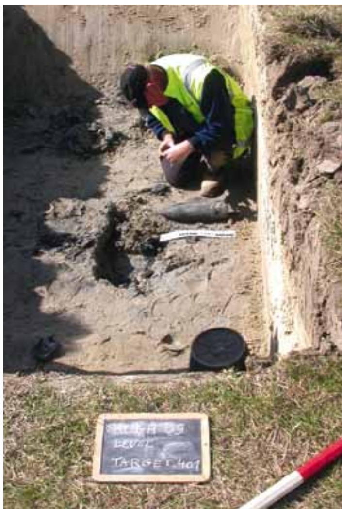
Een obus aan de voeten van een ontmijner. In totaal werden zes obussen bovengedaald.

In de eerste zone werden ook twee grachten aangetroffen, die vermoedelijk de