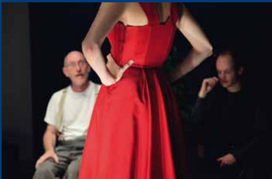
Is het huwelijk een gevangenis voor de vrouw? Misschien geeft het stuk Ibsen een antwoord op die prangende vraag...

Lucas: “Ik ben altijd acteur geweest. En regisseren is voor mij eigenlijk niet anders. Het is heerlijk en