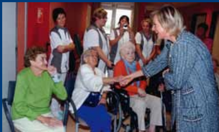
In het instituut maakte de prinses een rondleiding mee. Ze werd er door de bewoners hartelijk verwelkomd!