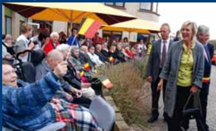
Aan de hoofdingang van het Koningin Elisabeth Instituut werd prinses Astrid opgewacht door een lange rij patiënten en personeel.