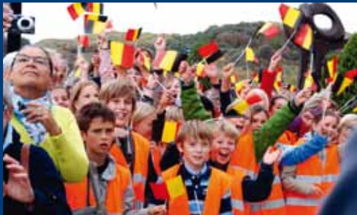
De schoolkinderen waren massaal aanwezig om de prinses te verwelkomen.

Hare Koninklijke Hoogheid Prinses Astrid bracht op dinsdag 29 september een bezoek aan het Koningin Elisabeth Instituut in de Dewittelaan in Oostduinkerke. De prinses was vorig jaar in april al in Koksijde te gast ter gelegenheid van de viering van 50 jaar KEI, maar kon toen het ziekenhuis zelf niet bezichtigen. Daarom kwam ze speciaal terug om kennis te maken met de zorginstelling. Ons gemeentebestuur verleende zijn volledige medewerking aan de organisatie van dit prinselijk bezoek. De foto's spreken voor zich!