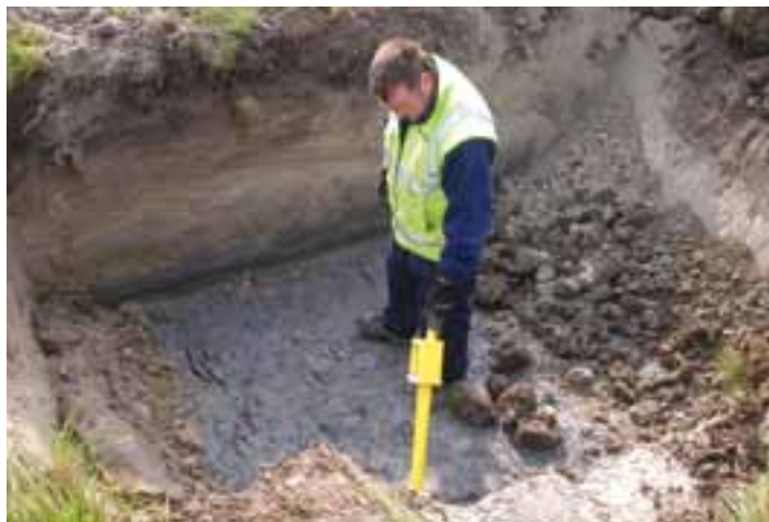
De bodem wordt met een bijzonder toestel gescand op sporen van ijzer.

De voorbereidende werkzaamheden voor de eigenlijke start van de Ecogolf Hof ter Hille vorderen vlot. Wanneer de aanleg van het golfterrein zelf kan beginnen, is nog niet duidelijk want het blijft nog wachten op de stedenbouwkundige vergunning. Maar inmiddels hebben ontmijners een aantal plaatsen op de betrokken gronden van munitie gezuiverd, en ondertussen is het archeologisch onderzoek bezig. Dat is belangrijk want de terreinen van de toekomstige Golf herbergen heel wat belangrijke informatie uit vervlogen tijden.