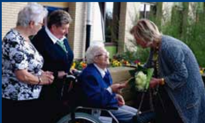
Met sommige verblijvers had de prinses een lange en vriendelijke babbel.