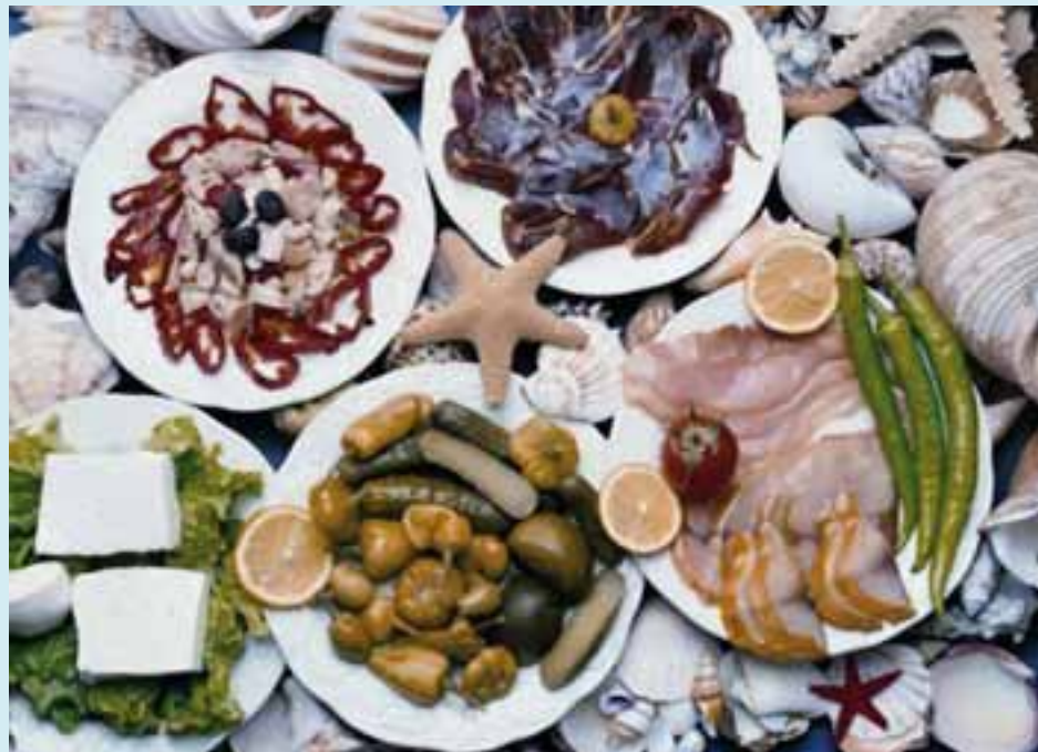
Turks eten, Turkse sfeer, muziek, buikdanseres...

Zin om u even in Turkije te wanen? Kom dan op 15 november naar het gemeentehuis. De burgemeester, de hotelschool Ter Duinen en enkele kokende kids zullen uw smaakpapillen verwennen! Een gastronomische mini trip naar Turkije op een boogscheut van uw thuis....!