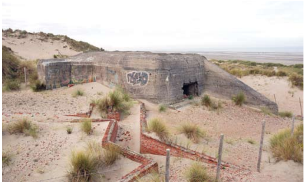
Een gedeelte van het Widerstandsnest Waldersee op Groenendijk: unieke restanten van de vroegere Atlantikwall...

Tijdens de gemeenteraadszitting van 15 september hebben de raadsleden unaniem en bij hoogdringendheid een tweede motie goedgekeurd tot behoud van de restanten van het bunkercomplex Widerstandsnest (WN) Waldersee op Groenendijk. Een eerste motie daarvoor werd door de gemeenteraad al op 11 september 2006 aangenomen. De raad nam op 15 september 2008 opnieuw dit initiatief wegens urgentie: de grond is immers eigendom van het Vlaamse Gewest (ter discussie) en een afbraak is dreigend. Nochtans bewijst een studie van Hannes De Zutter overtuigend het cultuurhistorisch belang van dit complex.