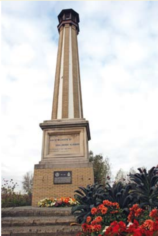
Het monument van de Geallieerde Vliegeniers op de rotonde bij de Zuid-Abdijmolen. Naar goed gebruik vond op zaterdag 11 oktober het jaarlijks eerbetoon aan het monument plaats met neerlegging van bloemen, optocht en defilé.

Het gemeentebestuur heeft een tweede druk klaar van de merkwaardige brochure “Herinneringen aan zestig jaar bevrijding Wereldoorlog ‘40-’44 / negentig jaar begin Wereldoorlog ‘14-’18” . Deze brochure (72 bl.) werd vier jaar