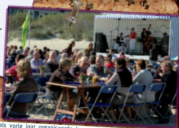
4. Net zoals vorig jaar organiseerde Jaycees Veurne-Westkust de Dag van de Vriendschap. Aldus kwamen op zondag 2 september weer een 2.000-tal personen op het strand van Oostduinkerke bijeen om te genieten van een "Fin Saison degustatie-aperitief". Onder het motto "breng je vrienden samen voor een gezellig aperitief op het strand" werd menig glaasje achterover gekipt ten voordele van een goed doel.