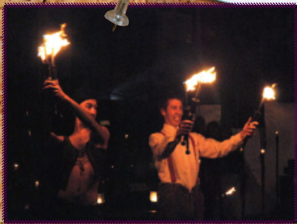
1. Op zondag 19 augustus beleefde Sint-Idesbald zijn hoogtepunt met de manifestatie "Sint-Idesbald in Vuur en Vlam", gevolgd door een groot vuurwerkspektakel op het strand.