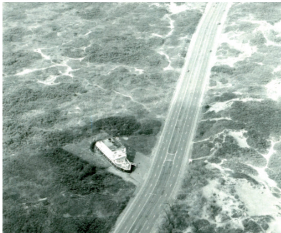
De Normandie vaart door de duinen... (Foto gemeentelijk archief, 1975)

De Monumentenprijs bekroont een project met een voorbeeldfunctie. De winnaar wordt gekozen uit een lijst met vijf kandidaten, één uit elke provincie.