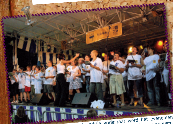
3. Na het succes van de eerste editie vorig jaar werd het evenement "Koksijde zingt" weer op de affiche geplaatst. Op zaterdag 25 augustus om 19 u. op het Theaterplein in Koksijde-bad. Onder de merknaam "Vlaanderen zingt" ging jong en oud weer uit de bol tijdens dit mas-sazangspektakel. Iedereen zong mee met de tijdloze klassiekers aan de hand van krantjes met de liedjesteksten.