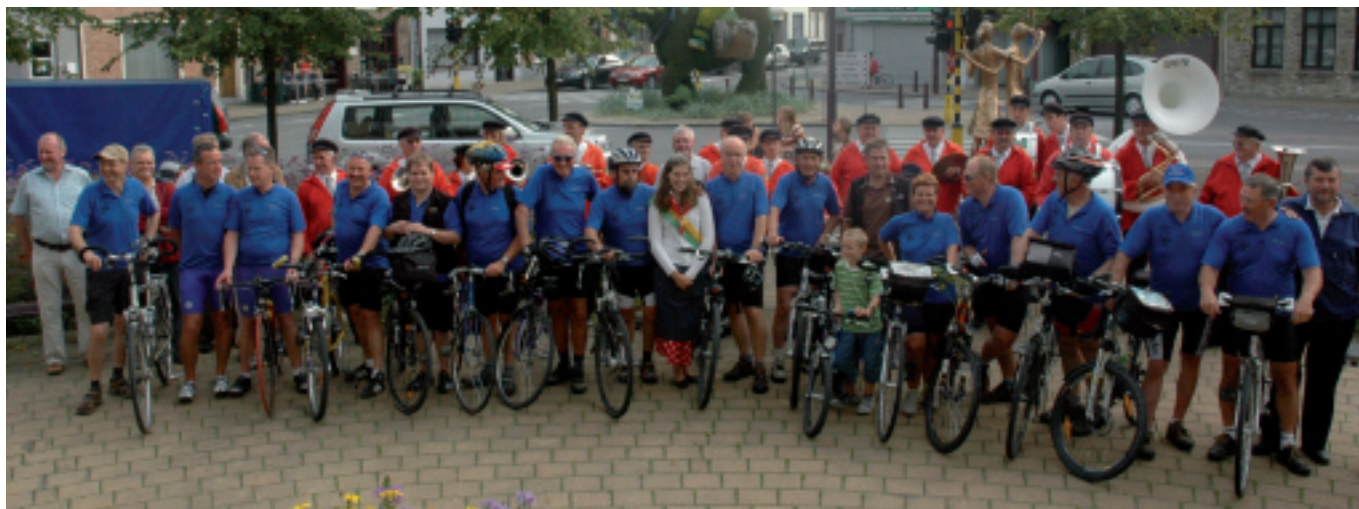
De fietsers van Biedenkopf en Oostduinkerke die in een week de afstand tussen beide jumelagegemeenten overbruggen.

Na de geslaagde fietstrip van Oostduinkerke naar Biedenkopf in 2006 konden de Duitse vrienden uit onze verbroederingsgemeente het natuurlijk niet nalaten om het dit jaar in de omgekeerde richting te organiseren.