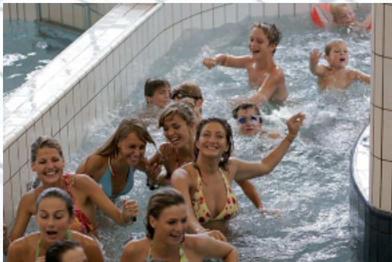
Samen het bad in met de hupse meiden van Miss Belgian Beauty... Wat wil je nog meer..?

Het gemeentebestuur wijst erop dat inwoners van Koksijde op hun verjaardag gratis mogen zwemmen in het Hoge Blekker-zwembad aan de Pylyserlaan in Koksijde-dorp en 's zomers in het openluchtzwembad op de Zeedijk van Oostduinkerke.