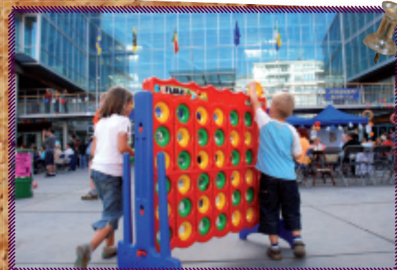
6. Speciaal voor jonge cultuurliefhebbers organiseerden de jeugdraad, jeugddienst, dienst Cultuur en de bibliotheek opnieuw het WASCO-weekend op vrijdag 7 en zaterdag 8 september. WASCO betekent wervelende actieve speelse creatieve opening. Voor de gelegenheid werd het Theaterplein omgetoverd in een bananabeach. Maar de kinderen op de foto bleken al tevreden met een reuzespelletje "Vier op een rij" in reuzenformaat.