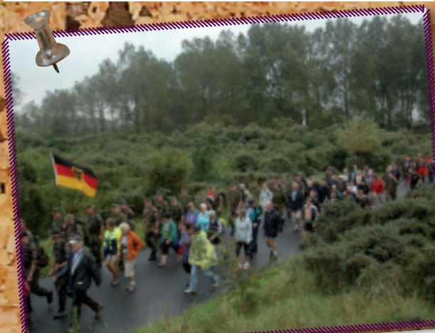
2. Van woensdag 22 tot en met zaterdag 25 augustus vond opnieuw de internationale wandeltocht Vierdaagse van de IJzer plaats, ooit een initiatief van de Orde van de Paardenvisser. Na de openingsplechtigheid in Oostduinkerke op dinsdag 21 augustus werd op de eerste marsdag, woensdag 22 augustus 32 km gewandeld door de prachtige natuurgebieden van de gemeente.