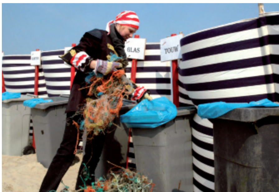
Eén van de Woeste Piraten ontfermt zich over een kluwen touw dat aanspoelde op het strand...

Overall aan de Vlaamse kust en dus ook in Koksijde vond op zaterdag 31 maart de vierde editie van de milieuvriendelijke actie Lenteprikkel plaats. Onder een stralend blauwe hemel en een fikse noordenwind daagden op ons Koksijdse strand ca. 250 vrijwilligers op, vooral gezinnen, maar ook veel natuurgidsen, om een handje toe te steken. Honderd vrijwilligers verzamelden 236 kg aangespoeld afval onder het toezicht van Woeste Willem en zijn piraten. De andere 150 deelnemers waren vooral geïnteresseerd in de speelse educatieve pakketten over natuurlijke aanspoelsels en hun nut bij duinvorming. Met z'n 250 vrijwilligers was Koksijde koploper over heel de kust.