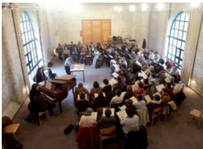
De deelnemende koren in volle repetitie in de abtskapel van Ten Bogaerde

Het Requiemproject moest al snel onderbroken worden door noodzakelijke werkzaamheden aan zijn laatste opera La Clemenza di Tito en aan de opera Zauberflöte. Toen hij weer aan het Requiem kon beginnen was hij al ernstig ziek. De eerste delen kon hij nog voltooien, maar bij het Lacrimosa moest