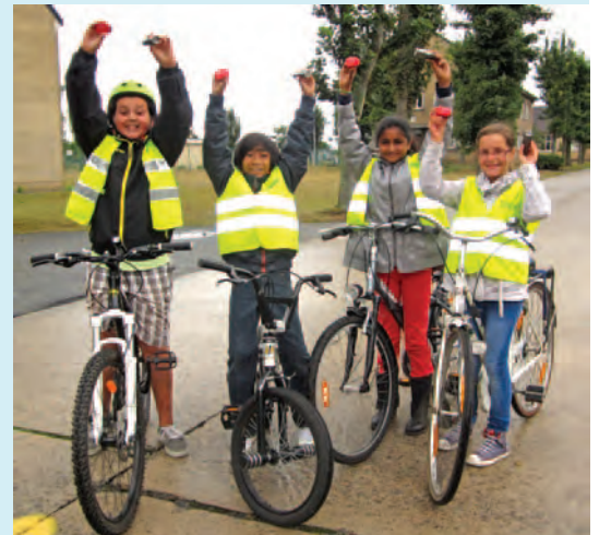
De politie start een project "fietslichten voor overtreeders" zodat fietsers met onvoldoende of defecte lichten hun weg kunnen vervolgen.

Deze actie kadert ook in de preventieve fietscontroles die PZ Westkust binnenkort weer zal uitvoeren in de scholen. De fietsen van de leerlingen worden dan gecontroleerd met ook aandacht voor de fietsverlichting. De politie zal hen preventief wijzen op de gevaren van rijden zonder licht. Na de preventieve fase volgen fietscontroles op de openbare weg.