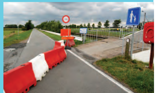
Op de Conterdijk moeten fietsers vanuit Veurne richting Wulpen de dijk verlaten, het kanaal (te voet) dwarsen over de Spijkerbrug en hun weg voortzetten op de N39 naar Wulpen.

De werken zullen 2 jaar duren. De NV Aquafin liet wel weten dat de verkeersregeling niet gedurende de volledige periode van toepassing zal zijn. De weggebruikers worden wel aangeraden om de signalisatie te respecteren!