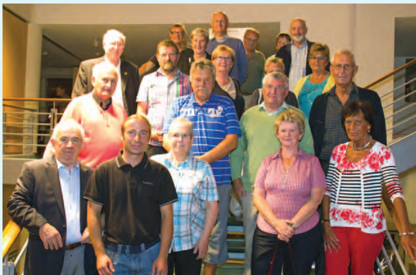
Organisatoren en winnaars van de zomerfietszoektocht De Gordel rond Koksijde.

Elke deelnemer die het antwoordformulier indijende had prijs. De volledige lijst met de uitslag is in te kijken in alle toerismekantoren van de gemeente. Niet-afgehaalde prijzen liggen klaar in de dienst Toerisme in Koksijde-Bad tot eind december, mits voorleggen van het kladblad.