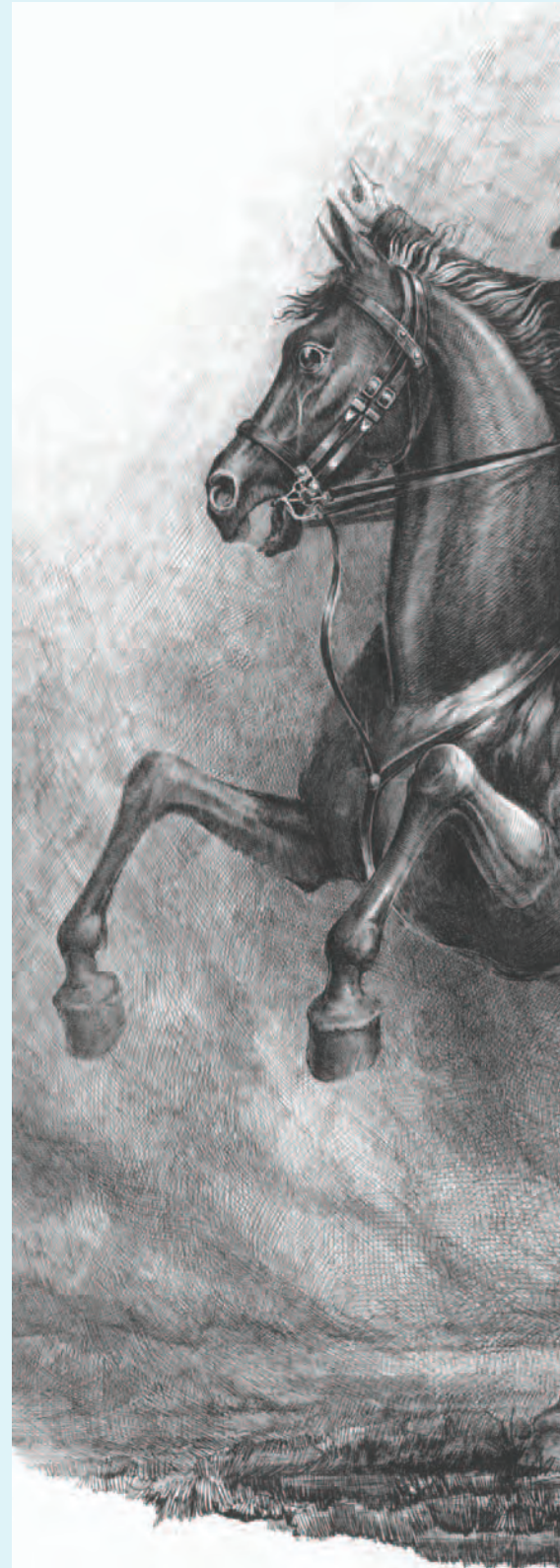
Napoleon Buonaparte, keizer van Frankrijk van 1804 tot 1815.

Deze keer gebeurt de passage van de Keizer der Fransen n.a.v. een reis van Parijs naar Boulogne en Oostende, waar de Franse Marine een invasievloot voor Engeland aan het bouwen is.