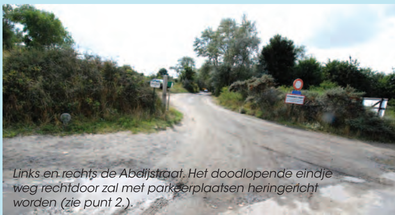
Links en rechts de Abdijstraat. Het doodlopende eindje weg rechtdoor zal met parkeerplaatsen heringericht worden (zie punt 2.).