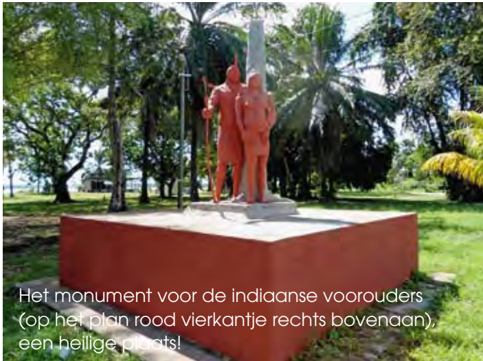
Het monument voor de indiaanse voorouders (op het plan rood vierkantje rechts bovenaan), een heilige plaats!

een uitkijktoren. Deze pier, gebouwd met rotsblokken, biedt veel recreatieve mogelijkheden, o.a. om te zwemmen, te duiken en te vissen. Het nieuwe strandje is rechts door rotsen beschermd. Links is een aanlegplaats voor korjalen (inheemse bootjes). Links in de ovaal komt er een trapveldje.