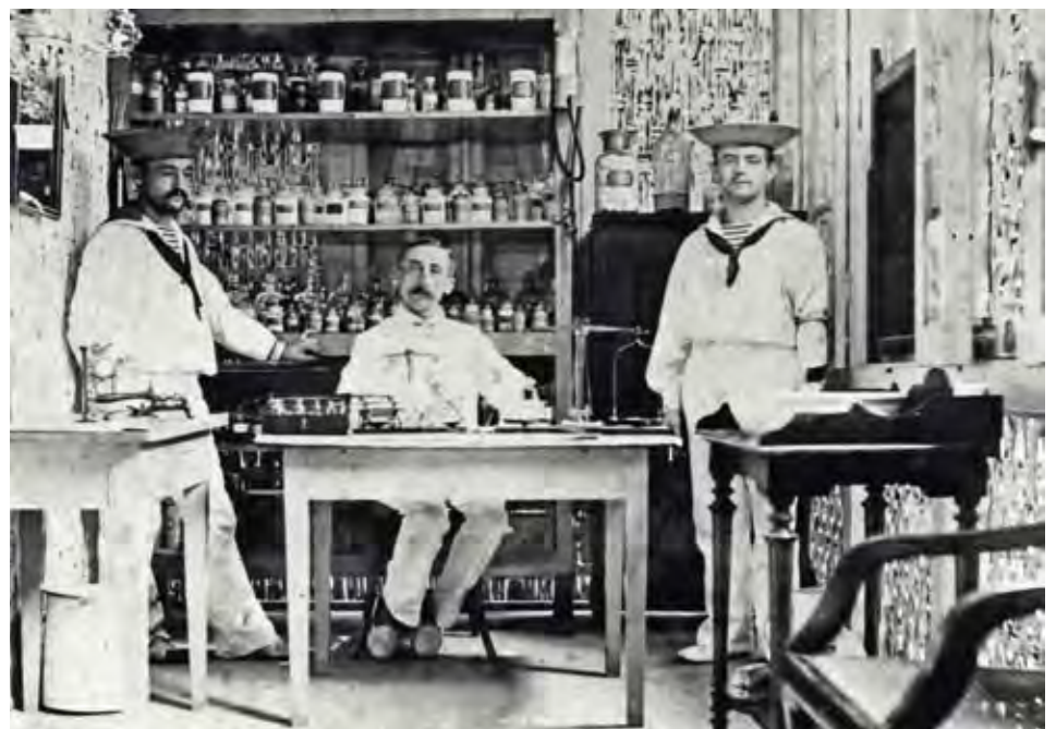
Een foto uit het archief van het Nederlands Instituut voor Militaire Historie: stoere Nederlandse zeelieden... stierven ze aan rode loop, scheurbuik of ongevallen?

Uiteraard wordt er ook ruim tijd voorzien voor vragen van het publiek. De studiedag begint om 13.30 u., de lezingen gaan van start om 14 u. Omstreeks 17.15 u. wordt de studiedag met een drink afgerond. Deze studiedag is tegelijk een stuk promotie en een inspiratiebron voor de derde grote zomere expo in het NAVIGO-museum, nl. van 7 juni tot 17 november 2013. Niet voor niets is de titel van deze tentoonstelling Zeeziek. Hoe kolkt de waanzinnige zee in lichaam en geest? Deelnemen aan de studiedag, koffie en afsluitende drink inbegrepen, kost 10 euro. Gidsen, vrienden van het Nationaal Visserijmuseum, inwoners van de gemeente Koksijde en studenten betalen slechts 5 euro. Aanmelden is verplicht en kan tot 9 maart via info@navigomuseum.be . Het inschrijvingsgeld wordt de dag zelf contant betaald.