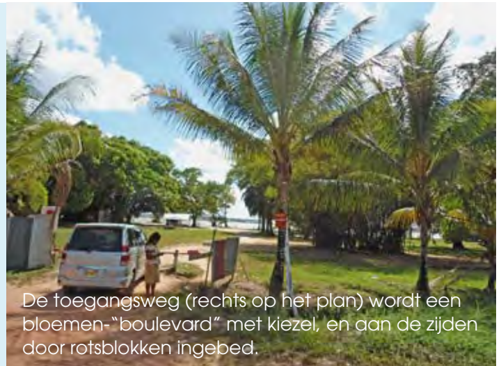
De toegangsweg (rechts op het plan) wordt een bloemen-“boulevard” met kiezel, en aan de zijden door rotsblokken ingebed.

een uitkijktoren. Deze pier, gebouwd met rotsblokken, biedt veel recreatieve mogelijkheden, o.a. om te zwemmen, te duiken en te vissen. Het nieuwe strandje is rechts door rotsen beschermd. Links is een aanlegplaats voor korjalen (inheemse bootjes). Links in de ovaal komt er een trapveldje.