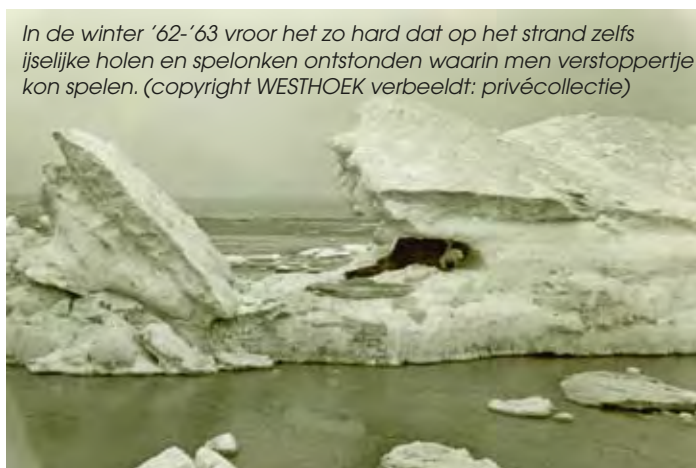
In de winter '62-'63 vroom het zo hard dat op het strand zelfs ijselijke holen en spelonken ontstonden waarin men verstoppertje kon spelen.

Die memorabele winter '62-'63 was de strengste ooit in België sinds het begin van de meteorologische waarnemingen in 1815. Zelfs het strandwater bevroor en er ontstonden hoge vreemde ijsconstructies met grillige holen en spelonken... De kinderen konden er waarachtig verstoppertje in spelen! Uiteraard vrozen ook rivieren en kanalen dicht met ijsdikten van 20