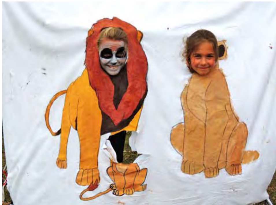
Er is voor de eerste keer ook speelpleinwerking tijdens de paasvakantie!