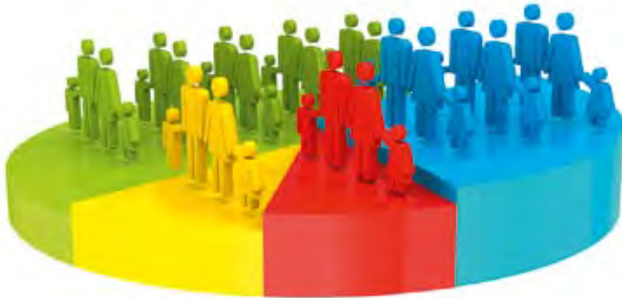
In 2012 werden 126 nieuwe kindjes in het Koksijdse bevolkingsregister ingeschreven.

Ook in 2012 is er geen geboorteoverschot. In dat jaar werden er 126 meisjes en jongens in de Koksijdse registers ingeschreven, terwijl daartegenover 251 vrouwen en mannen het tijdelijke met het eeuwige ruilden. Dat betekent een natuurlijk verlies van 125 personen.