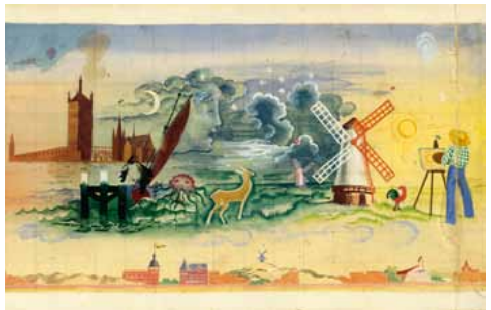
Dit is maar een klein fragment van het volledige werk. Het toont onderaan beeldbepalende gebouwen van Koksijde zoals de Keunekapel en de Hoge Blekkermolen, en centraal o.a. de kunstenaar van Sint-Idesbald, een figuur in de wolken en het staketsel van Nieuwpoort-bad.

lijst en plexiglas. Omwille van het uitbreken van de Tweede Wereldoorlog werd de tentoonstelling in Luik vroegtijdig afgebroken. Maar 71 jaar later kreeg het kunstwerk nu een nieuwe openbare plaats waar het door iedereen kan bewonderd worden.