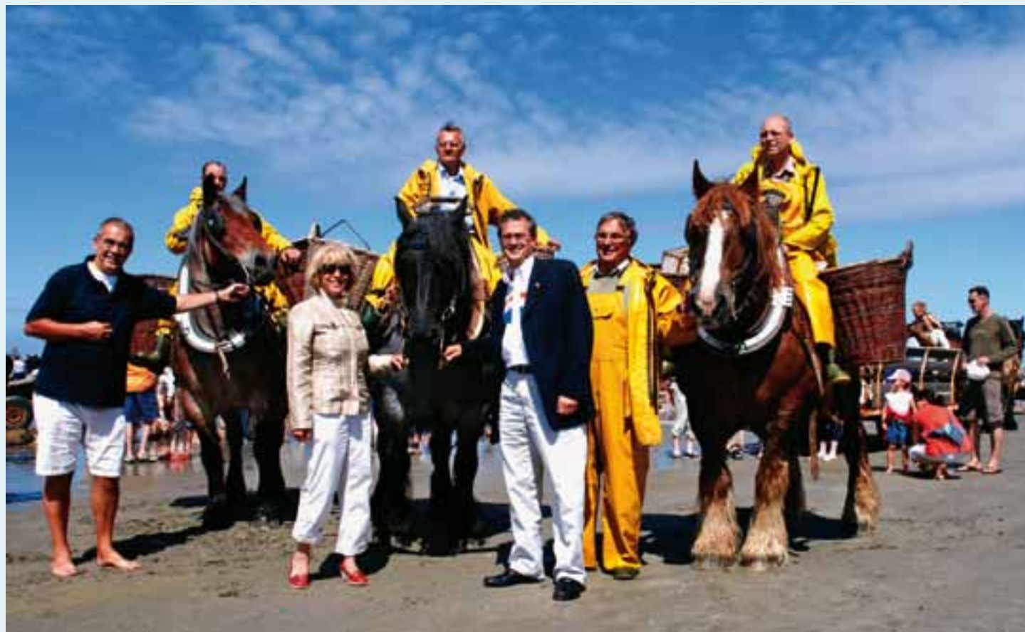
Op 5 augustus wijdde 1ste schepen Jan Loones de USA-ambassadeur en zijn echtgenote in, in de geheimen van de garnaalvisserij te paard.

Zijne excellentie Howard Gutman, ambassadeur van de USA in België, heeft blijkbaar een boontje voor onze gemeente. De voorbije zomer kwam hij twee keer naar Koksijde: op vrijdag 25 juni bracht hij een bezoek aan de politiezone Westkust, en op donderdag 5 augustus maakte hij kennis met de KYC, met de paardenvissers en het visserijmuseum.