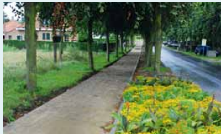
In de Japans Paviljoenstraat, richting Fastenaekelslaan, is al een deel van een nieuw voetpad met bloemperk klaar.

De uitvoering is volop bezig. Vanaf het begin van het nieuwe schooljaar zullen de kinderen al toegang hebben tot de school via het nieuw aangelegde voetpad komende van de Zeelaan. Na de aanleg van de voetpaden, busstopplaatsen en parkeerstroken, dient enkel nog het rijvak zelf aangelegd te worden. Einde van deze werken eind september.