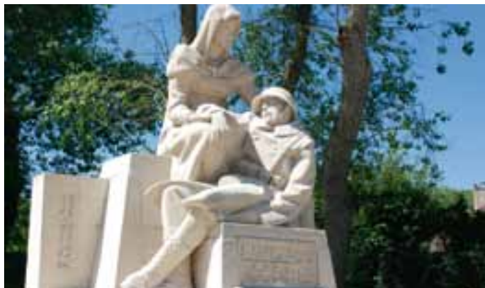
Het Monument voor de Gesneuvelden WO I van beeldhouwer Oscar Jespers

Gelegen in Oostduinkerke in de verkaveling van NV Matexi, nabij de Polderstraat. Oscar Jespers (°Borghout 1887 + Brussel 1970) was beeldhouwer. In de jaren '20 hakte hij vooral beelden in marmer en aanverwante materialen in kubistische stijl. Uit deze periode stamt het wit natuursteen "Monument voor de Gesneuvelden" van WO I in Oostduinkerke. Dit kunstwerk staat naast de Sint-Niklaaskerk. Werken van Oscar Jespers bevinden zich in veel belangrijke musea waaronder in het Antwerpse beeldenpark Middelheim, en in het Kröller-Müller museum op de Hoge Veluwe in Nederland.