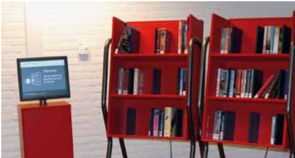
Links het nieuwe RFID-systeem, en rechts twee trolley's waarop de ingeleverde boeken moeten geplaatst worden.

De personeelsbalies van de bibliotheek worden van maandag 20 tot en met dinsdag 28 september heringericht omdat een nieuwe stap in het automatiseringsproces gezet wordt. In die periode is de bibliotheek gesloten. Op woensdag 29 september is de bieb weer toegankelijk (onder voorbehoud). Het binnenbrengen van materialen blijft mogelijk tot en met 18 september.