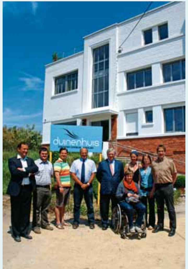
Op donderdag 24 juni werd het Duinenhuis in de Schipgatduinen officieel geopend door het college van burgemeester en schepenen.

Interesse om volgend jaar zelf als animator aan de slag te gaan? Of wil je het Duinenhuis met je jeugdvereniging of klas ontdekken? Meld je bij het Duinenhuis, duinenhuis@koksijde.be, T 058 52 48 17