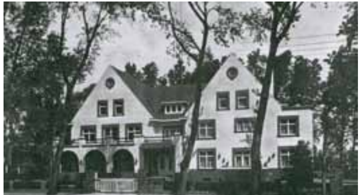
Het vroegere home 't Zandkasteeltje.

Gelegen in de verkaveling van NV Sint-Idesbald Invest tussen de straten Veurnelaan, Dageraadstraat en Marie-Joséstraat. Het betreft een bouwterrein dat 56 loten omvat en een woonerf zal vormen. Vroeger stond daar het inmiddels afgebroken home 't Zandkasteeltje, Veurnelaan 56.