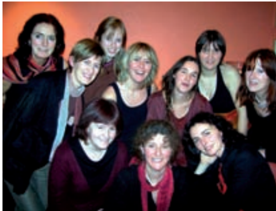
De groep Belladonna won de tweede editie van DemoDunia.

Daarnaast wordt op dit volksfeest een levendige partij live muziek aangeboden. Dit jaar opent de West-Vlaamse groep Belladonna . Dat is de groep die de tweede editie won van DemoDunia, een demowedstrijd die aan het Wereldfeest Dunia verbonden is. De eerste prijs van die wedstrijd is dan ook een optreden op het wereldfeest, ondersteund door een professionele klankinstallatie. Belladonna bestaat uit 11 mooie vrouwen die op hemelse vierstemmige wijze zingen in ver-