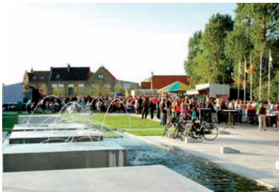
Een algemeen beeld van de prachtig heraanagelegde dorpsplaats naar een ontwerp van het Buro voor Vrije Ruimte.

De nieuwe Dorpsplaats (riolering en bovenbouw) werd geraamd op 1.499.215 euro. De rioleringen zijn betoelaagd voor 475.000 euro. De fietsenstalling en bijhorende accommodatie werd geraamd op 86.000 euro en werd voor 34.000 euro door Toerisme Vlaanderen gesubsidieerd.