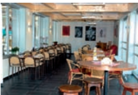
De cafeteria kreeg een aanzienlijke uitbreiding...