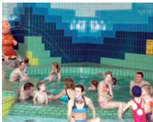
Het nieuwe kinderbad (32°) met streekgebonden spuitfiguren waar blijkbaar ook ouderen zich thuisvoelen...