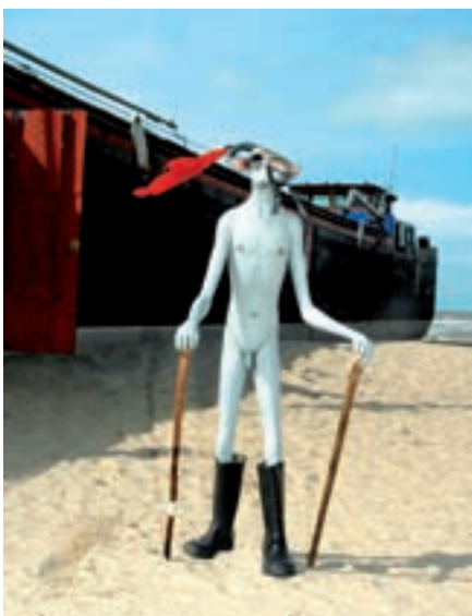
Uit de romp van het schip stapt een dierlijke figuur met horens, hij is de harbinger; de voorbode...

Op en in het gestrande binnenvaartuig is het kunstwerk "Harbinger with barge and imperial landscape" van de Zuid-Afrikaanse kunstenaar Jane Alexander te bewonderen. Uit de romp van het