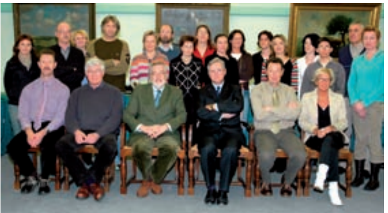
Na het laatste schepencollege volgt onvermijdelijk ook de afscheidsfoto met een deel van het schepencollege en de personeelsleden van het eigenlijke gemeentehuis.