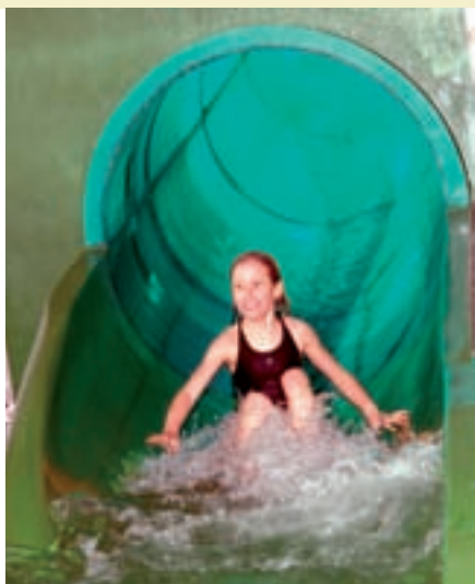
Voor wie houdt van sensatie: de nieuwe glij-tunnel!

daat-zwemmers, zodat ze de nodige zwemknepen onder de knie te krijgen. Deze twee baden kregen elk een nieuwe antislipvloer en boordstenen.