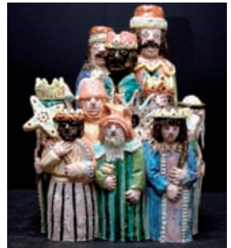
De Driekoningen, een prachtige beeldengroep.