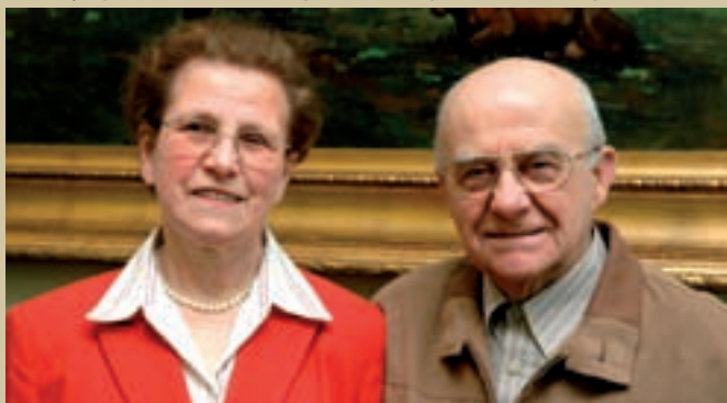
André en Godelieve

Vijftig jaar geleden stapten Etienne Walraeve en Suzanna Meirlaen in het huwelijksbootje in Merelbeke. Beroepshalve was Etienne ploegbaas-metaalbewerker bij Arbed in Gent. Op zaterdag 25 maart werd het echtpaar hartelijk ontvangen in het oud-gemeentehuis van Oostduinkerke. De jubilerende echtelingen werden gefeliciteerd, ontvingen bloemen en geschenken.