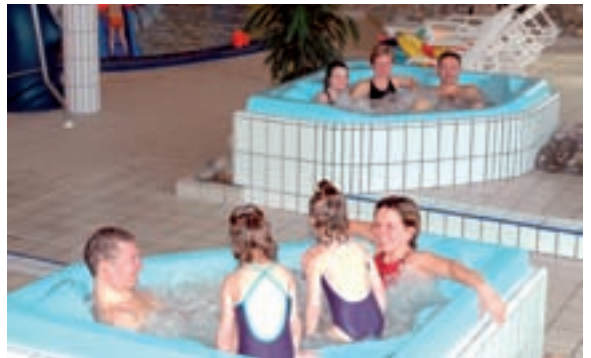
In de nieuwe whirlpools is het heerlijk relaxen...

Het vernieuwde zwempaleis "draait" op de meest moderne technieken, geplaatst in een ondergrondse ruimte. Sturingen, aanpassingen en correcties gebeuren met computer vanuit het bureau van beheerder Marc Supeley.