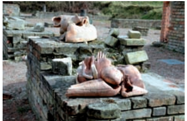
In het ruïneveld van de Duinenabdij liggen 33 levensgrote sculpturen in terracotta. Ze lijken in diepe slaap verzonken.

In het ruïneveld van de Duinenabdij liggen ter gelegenheid van Beaufort 2006 1 dormienti, De slapenden... Dit kunstwerk bestaat uit 33 levensgrote sculpturen in terracotta. De gestileerde figuren liggen in een beschermende foetushou-